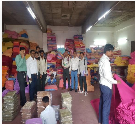
Stdents and Staff at packaging unit at Gujja Textiles