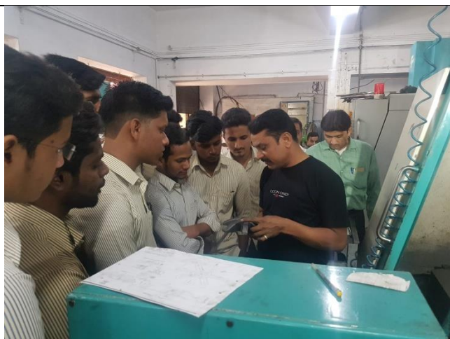
Guiding to Stdents and Staff about Machine Maintenace