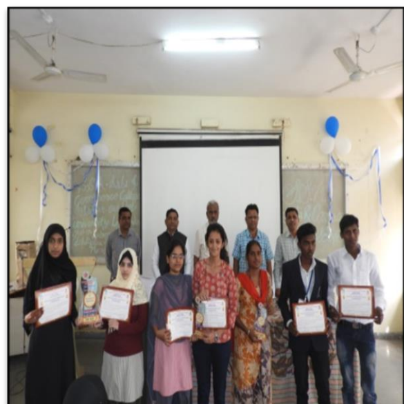
Best Research paper Students awarded with Certificates