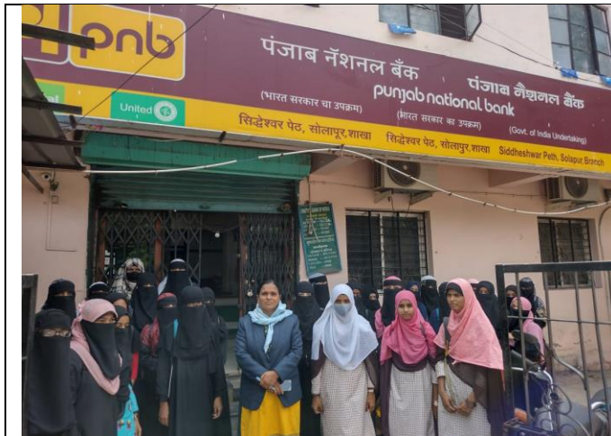
Students while visiting PNB at Siddheshwar peth