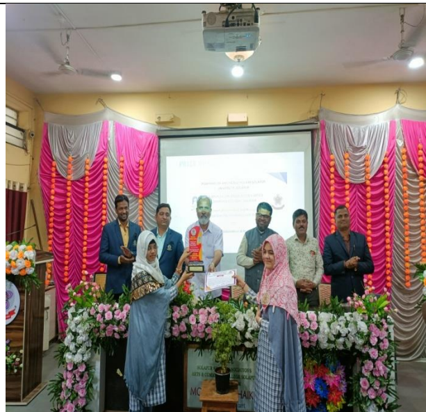
Best Research paper Students awarded with Certificate and Shield