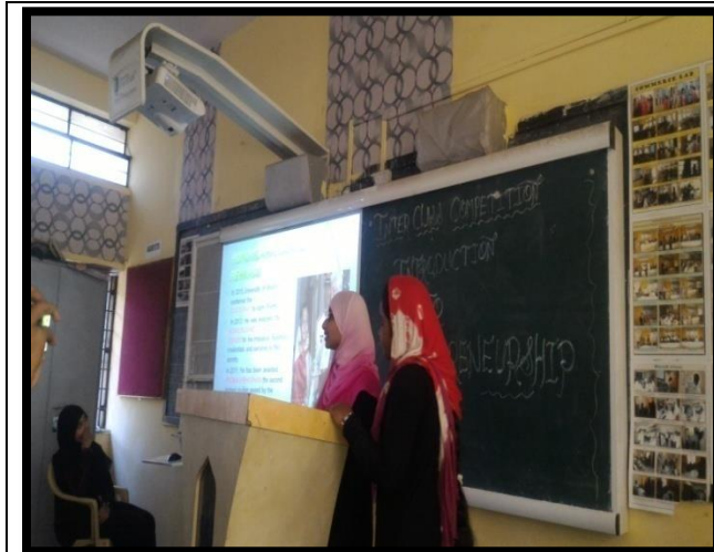
Students presentation on Entrepreneurship Skills