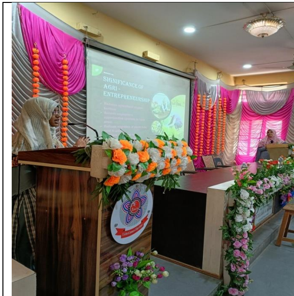
Students presenting Research Paper