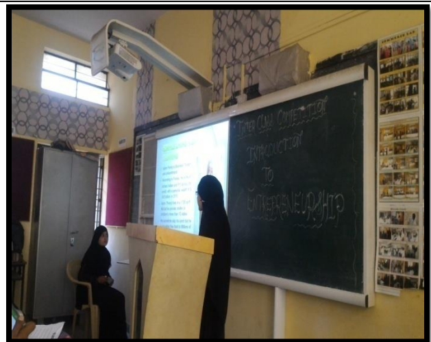
Students presentation on Ajim Premaji (Wipro Group) : Entrepreneurship Skills and Journey