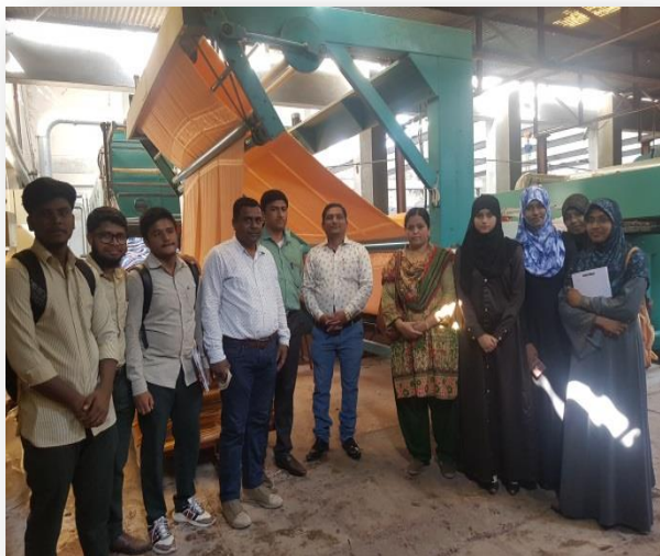
Stdents and Staff at coloring unit at Gujja Textiles