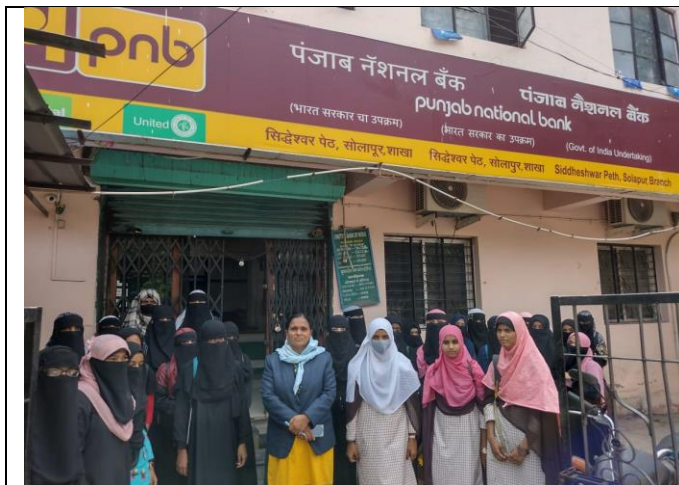
Students while visiting PNB at Siddheshwar peth