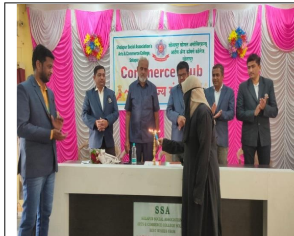
Inuagaration of Commerce Club