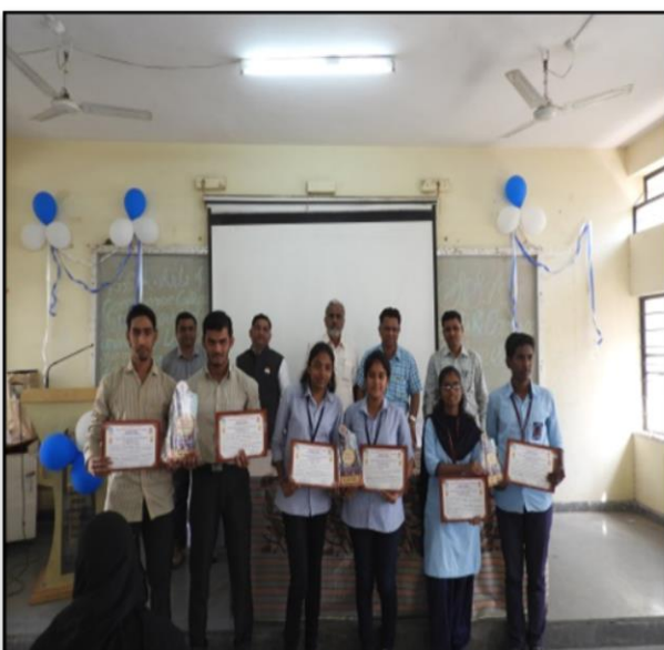
Best Research paper Students awarded with Certificates