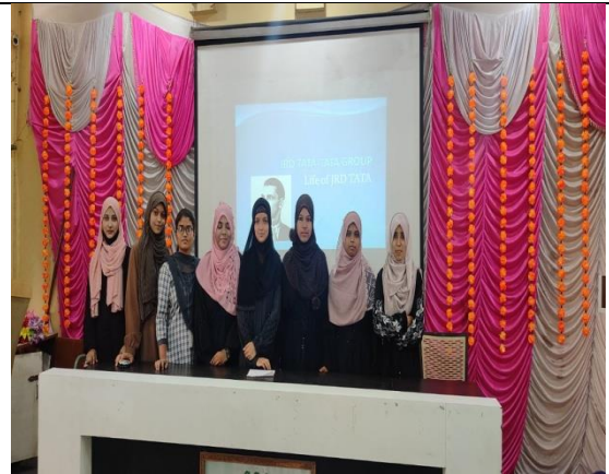
A group while giving presentation in the Group Competition on 'An Introduction to Entrepreneurship'