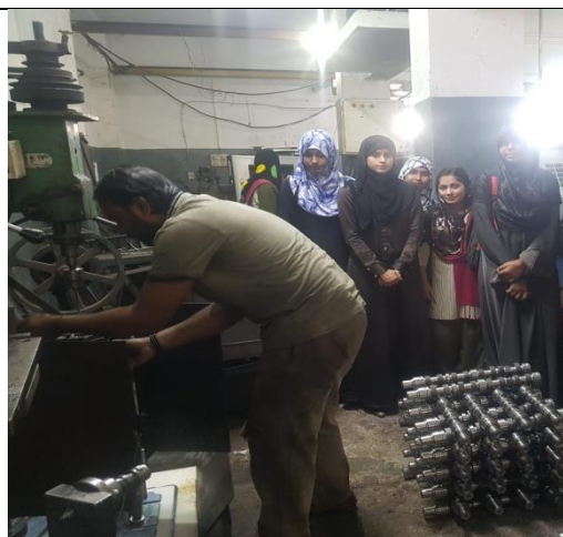
Guiding to Stdents and Staff about Machine Maintenace