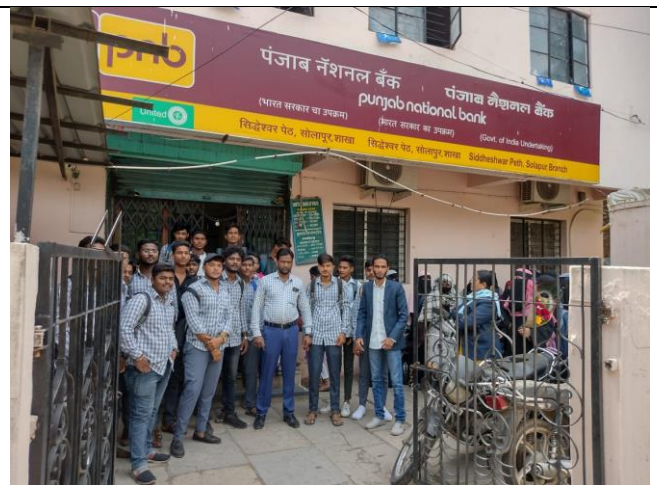
Students and teachers at the time of bank visit