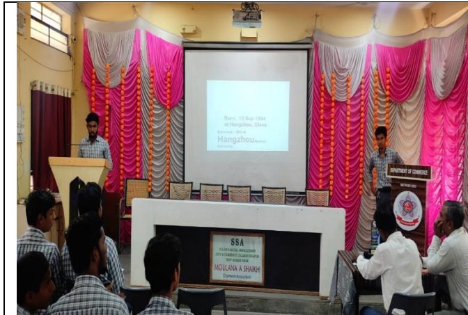
A group while giving presentation in the Group Competition on 'An Introduction to Entrepreneurship'